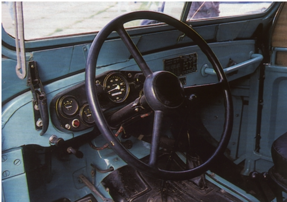
Рулевое колесо - трехспицевое, как на ГАЗ-51

Надо сказать, в период с 1945 по 1955 год легковые автомобили повышенной проходимости в техническом отношении получили меньшее развитие, чем грузовые. Единственным внедорожником, к разработке которого приступили в 1946 году, был ГАЗ-69.