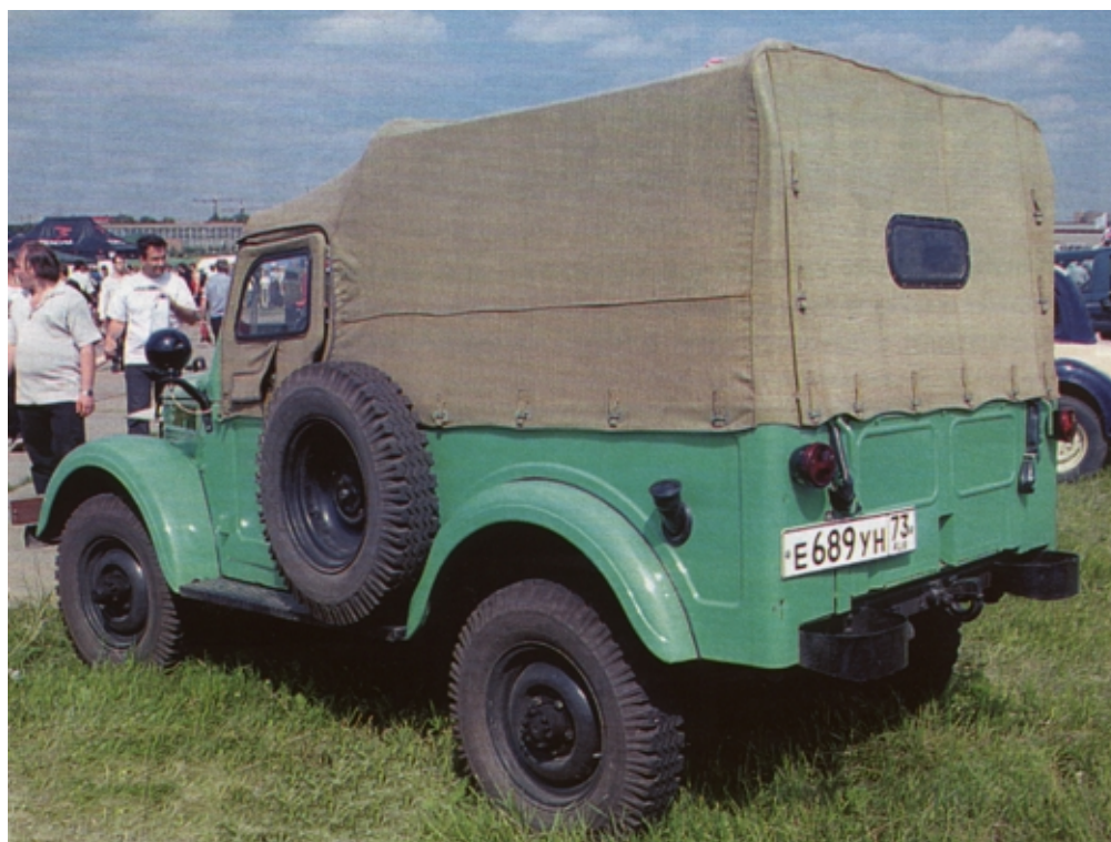
ГАЗ-69 имел двухдверный кузов с задним откидным бортом

На базе ГАЗ-69А изготавливали еще несколько модификаций, в том числе ГАЗ-19 - развозной фургон с цельнометаллическим кузовом, ведущим задним мостом. Сам Вассерман, продолжая развитие семейства полноприводных автомобилей, спроектировал в 1954 году более комфортабельную машину - ГАЗ-72. Этот автомобиль имел несущий кузов ГАЗ-М-20 и ходовую часть ГАЗ-69А.